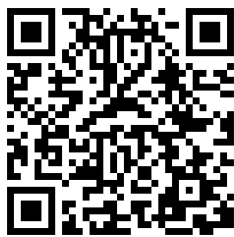
地域づくり推進課 ホームページ